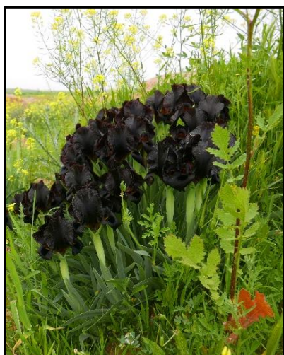
איור 2: אירוס שחום, (Iris atrofusca) , בשטח התכנית